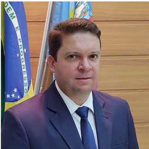
Carlinho Petrópolis Farmácia